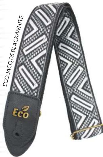
ECO JACQ 05 BLACK/WHITE