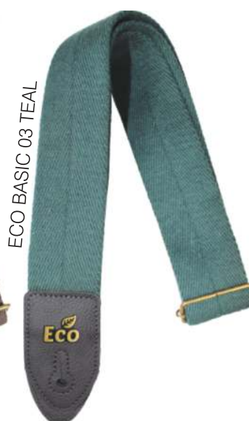
ECO BASIC 03 TEAL