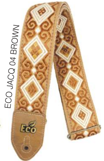
ECO JACQ 04 BROWN