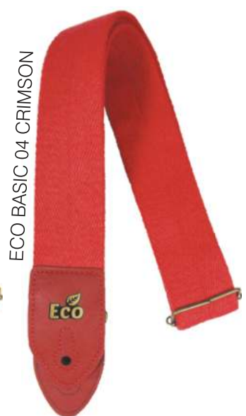
ECO BASIC 04 CRIMSON