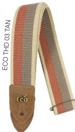
ECO THD 03 TAN