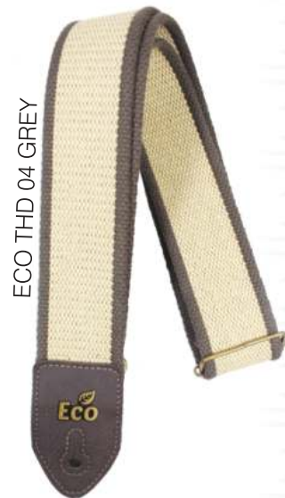
ECO THD 04 GREY