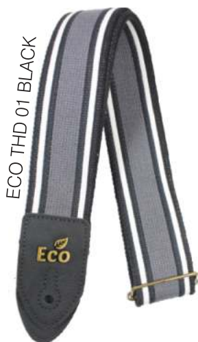
ECO THD 01 BLACK

Largura: 5 cm Comprimento: entre 0,85 e 1,50 metros. ALGODÃO RECICLAVEL