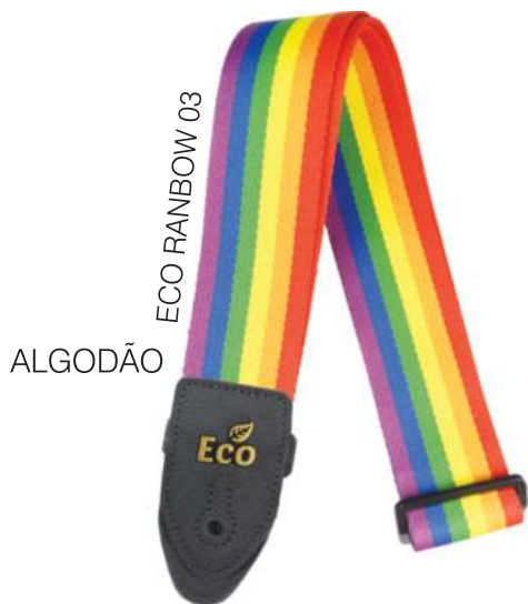
ECO RANBOW 03

Largura: 5 cm Comprimento: entre 0,85 e 1,50 metros.