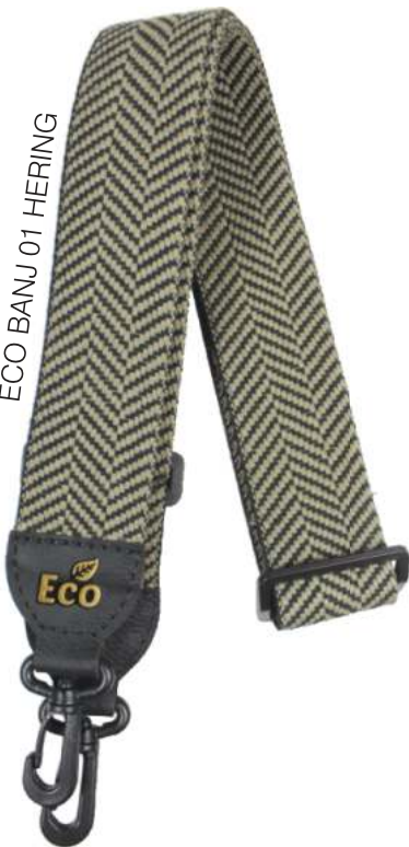
ECO BANJ 01 HERING