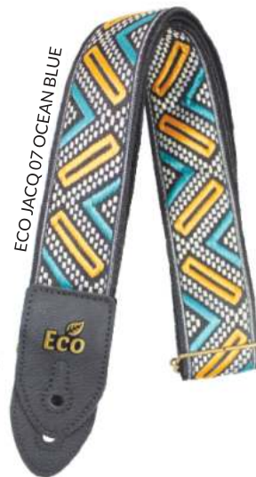
ECO JACQ 07 OCEAN BLUE