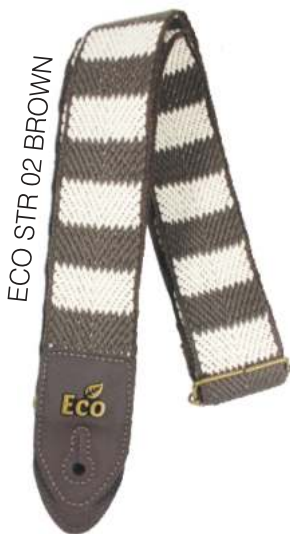
ECO STR 02 BROWN