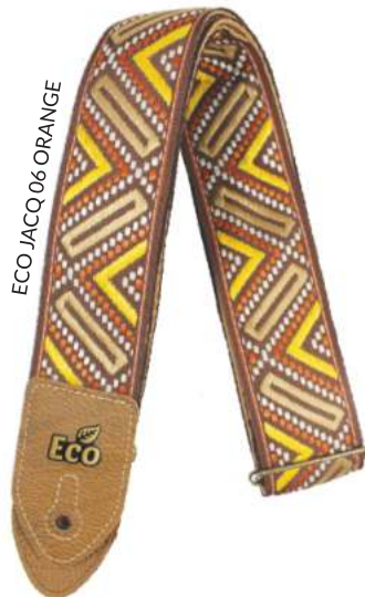
ECO JACQ 06 ORANGE