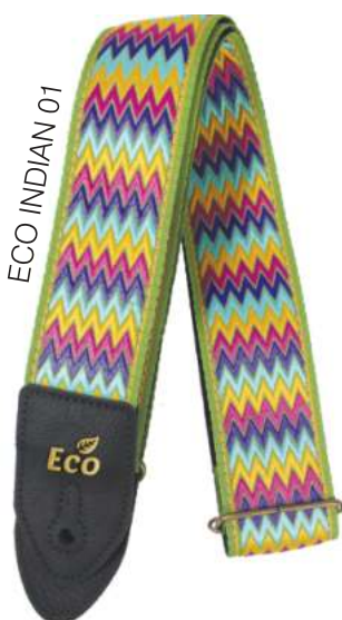
ECO INDIAN 01