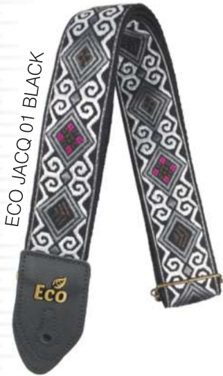
ECO JACQ 01 BLACK

Largura: 5 cm Comprimento: entre 0,85 e 1,50 metros. TECIDO JACQUARD