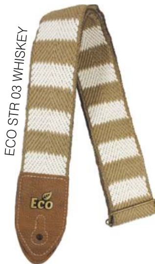
ECO STR 03 WHISKEY