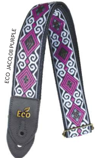
ECO JACQ 08 PURPLE