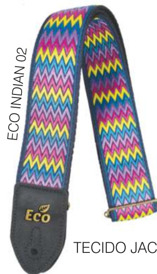
ECO INDIAN 02