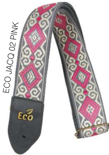
ECO JACQ 02 PINK