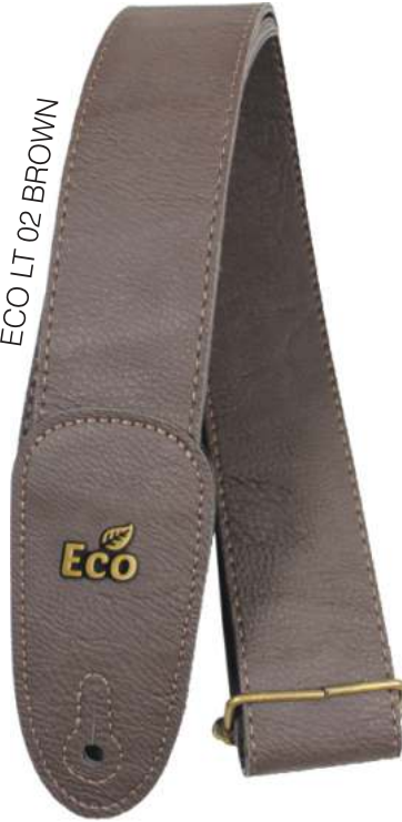
ECO LT 02 BROWN