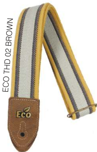
ECO THD 02 BROWN