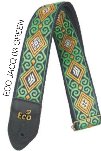
ECO JACQ 03 GREEN