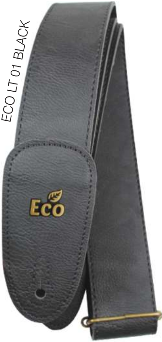
ECO LT 01 BLACK