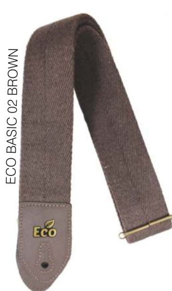
ECO BASIC 02 BROWN