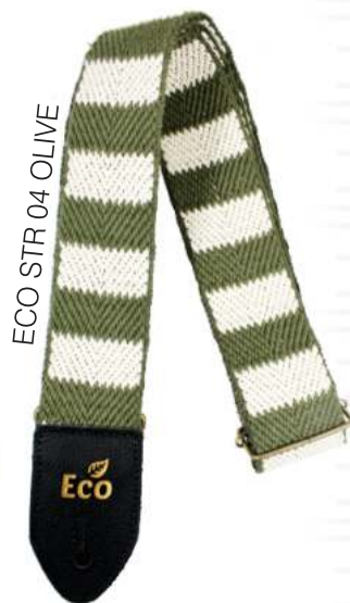
ECO STR 04 OLIVE