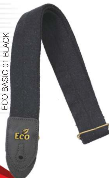
ECO BASIC 01 BLACK

Largura: 5 cm Comprimento: entre 0,85 e 1,50 metros. ALGODÃO RECICLADO