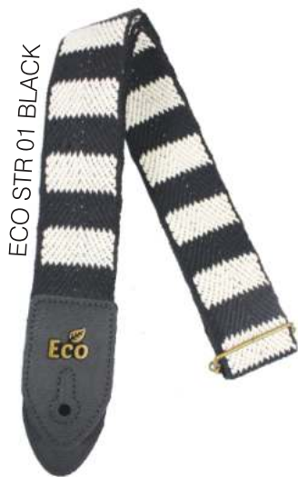
ECO STR 01 BLACK

Largura: 5 cm Comprimento: entre 0,85 e 1,50 metros. ALGODÃO RECICLAVEL